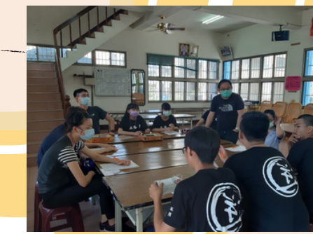
就服站-青少年探索團體