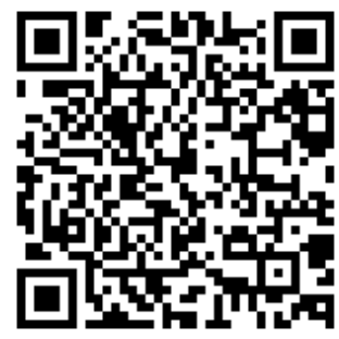
工作體驗店家報名表單