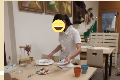
工作體驗-異國餐廳