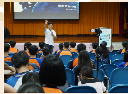
生涯講座-斜槓人生